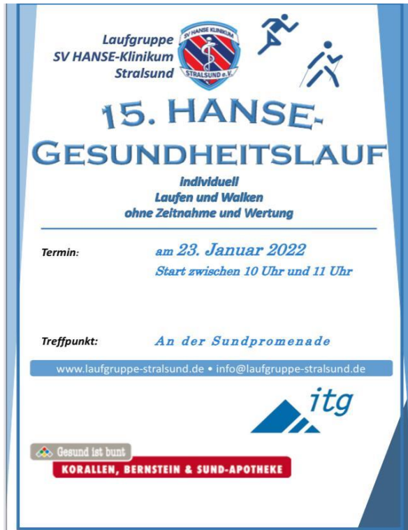
Die Ankündigung vom Verein.