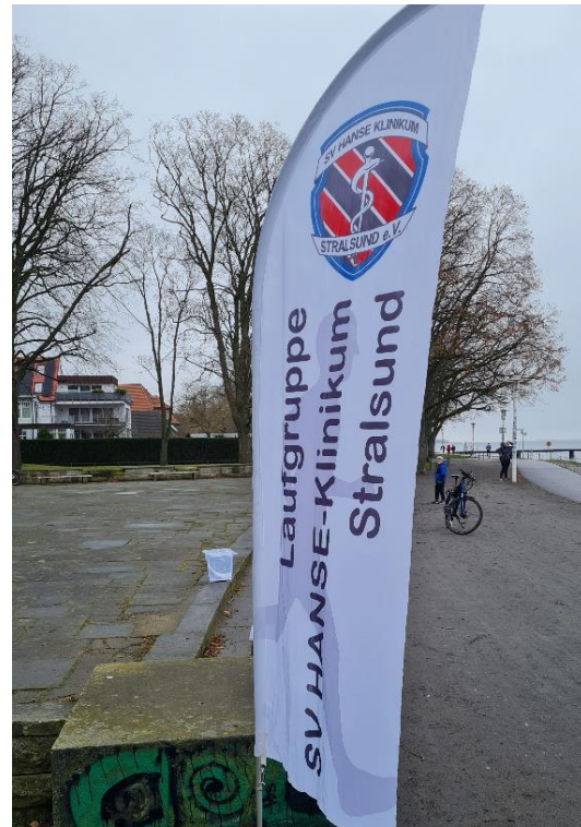
Die Fahne weht im Wind.

Alle Ampeln stehen auf Rot oder auch nicht. Coronaregeln werden durch andere Regeln wieder aufgehoben. Die Situation ist undurchsichtig und schwammig. Veranstaltungen sind entweder untersagt oder durch Zuschauer dezimiert besuchbar und auch wieder nicht. Jedes Bundesland (bzw Landkreis) hat da seine eigene Meinung und Verordnung. Egal! Irgendwie geht es ja immer weiter so wie in jeder Krise.