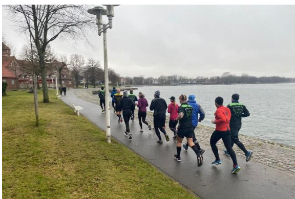
...schön mit Abstand laufend.