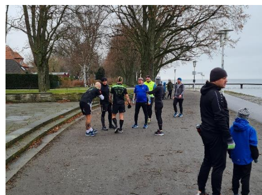
Kurzes Treffen mit Abstand.