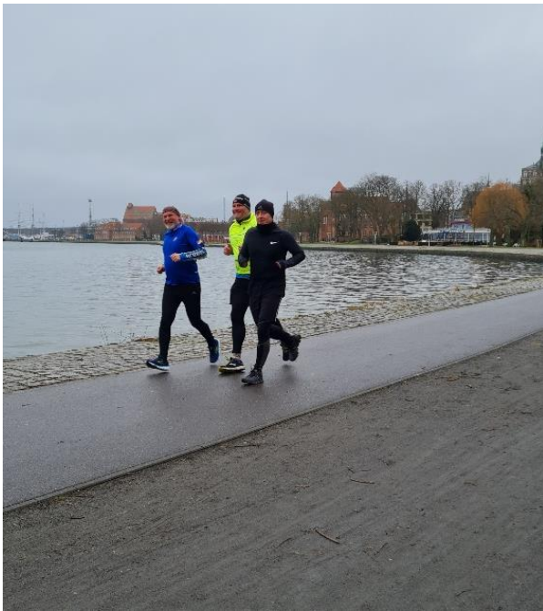
Gute Laune am Ufer.