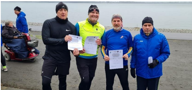
Alle sind Gewinner...

Wir hoffen, dass diese Veranstaltung weitergeführt wird und 2023 wieder mit einem Programm stattfinden darf. ENDE