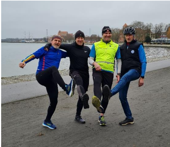
Zeigt her eure Schuhe und hoch das Bein.

Virtuelle Läufe sind die Alternative zu klassischen Laufevents mit Hunderten oder Tausenden Läuferinnen und Läufern, die aktuell nicht stattfinden können. So bleibt die Motivation erhalten – auch wenn "Ihr" Rennen ausgefallen ist. Laufevents, die so viele Sportler motivieren und für sie das Salz in der Suppe darstellen, gibt es also weiter, nur eben anders. An virtuellen Rennen können Sie meist an jedem beliebigen Ort, zu Ihrer Wunschzeit und oft auch an mehreren Tagen teilnehmen.